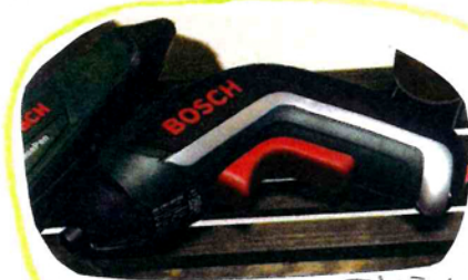
↑愛用しているドライバー