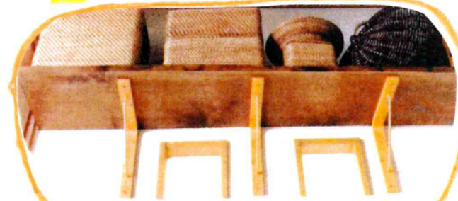
↑家に取りつけた棚