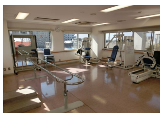
個別でパワーリハビリ